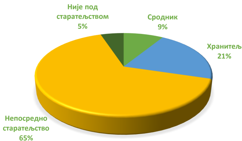
Графикон 2. Структура деце и младих на породичном смештају према врсти старатељске заштите

У 2023. години, на територији АПВ, 94.5% деце на породичном смештају је под старатељском заштитом. Када се посматра популација деце на породичном смештају која су под старатељском заштитом на дан 31.12.2023. године, доминира непосредно старатељство са уделом од 65,2%. 8,8% деце има сродника као старатеља. Удео хранитеља постављених за старатеља током 2023. године износи 21%.