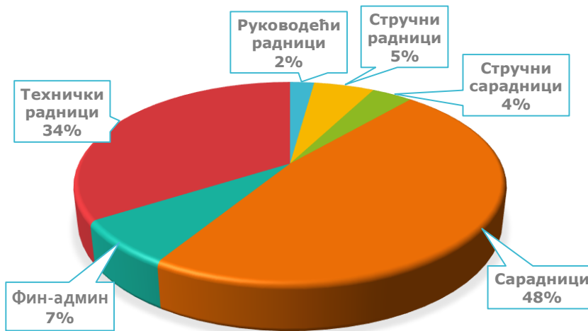
Табела 3. Број и структура запослених и ангажованих радника на дан 31.12.2022. према врсти радног места, ангажовања и извору финансирања