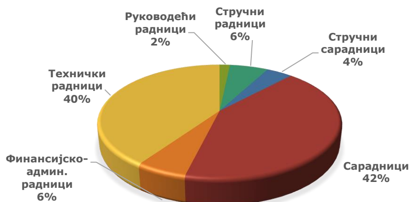
Табела 39. Број свих запослених и ангажованих радника на дан 31.12.2022. према статусу запослених